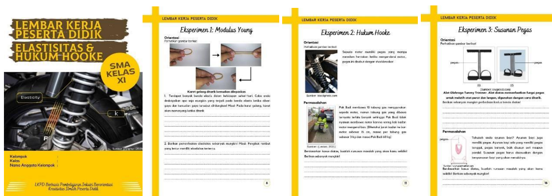
Gambar 3. Tangkapan Layar Beberapa Cuplikan Desain LKPD

Hasil studi dokumen tersebut merupakan dasar peneliti dalam pembuatan desain awal LKPD.