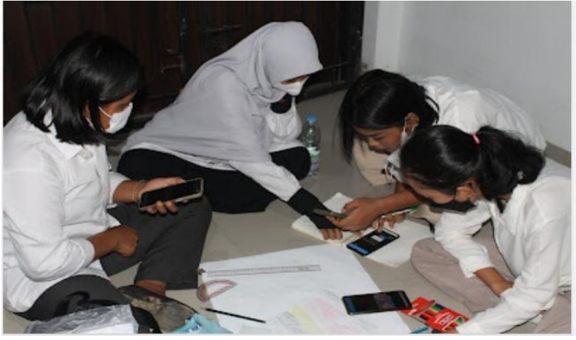
Gambar 2. Hasil Berdiskusi Mahasiswa

Diskusi adalah cara untuk memecahkan masalah dengan cara berfikir secara kelompok. Diskusi juga dapat diartikan sebagai kegiatan kolaboratif atau koordinasi yang melibatkan langkah-langkah dasar tertentu yang harus diikuti oleh seluruh kelompok. Diskusi pada dasarnya adalah bentuk pertukaran ide yang teratur dan terarah baik dalam kelompok kecil maupun besar dengan tujuan untuk memahami masalah, menyepakatinya, dan membuat keputusan bersama. Kegiatan diskusi juga memiliki fungsi untuk berfikir logis dan mengeluarkan pendapatnya sendiri mencakup persoalan-persoalan yang tidak dapat dipecahkan hanya satu jawaban tetapi memerlukan wawasan pengetahuan yang mampu mencari jawaban atau jalan terbaik hasil berfikir logis dan sistematis dari sebuah masalah (Nurdin, 2016).