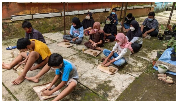
Gambar 3. Proses pembuatan kerajinan tanah liat oleh peserta didik