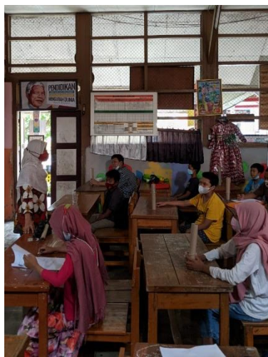
Gambar 2. Guru memberikan materi tentang kerajinan tanah liat