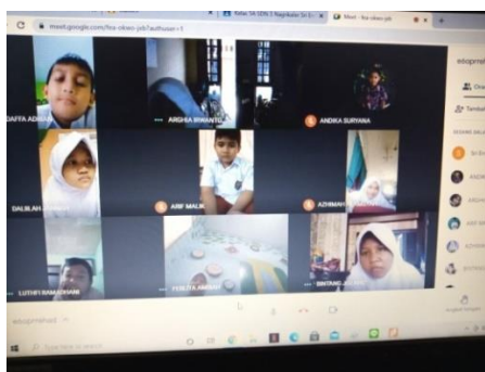
Gambar 1. Pemakaian seragam sekolah di Google Meet.

Dengan aplikasi ini guru dan siswa dapat berinteraksi langsung secara tatap maya. Tentunya untuk proses pembelajaran, bagi siswa yang tidak mempunyai perangkat untuk bergabung kedalam Google Meet dapat ikut bersama dengan teman yang tempat tinggalnya saling berdekatan. Pada gambar di atas menunjukkan bahwa para siswa belajar dengan tetap menggunakan seragam sekolah meskipun proses pembelajaran berlangsung secara daring atau online . Tentunya agar para siswa tetap bersemangat untuk belajar dan siap untuk menerima ilmu-ilmu baru dari Guru.