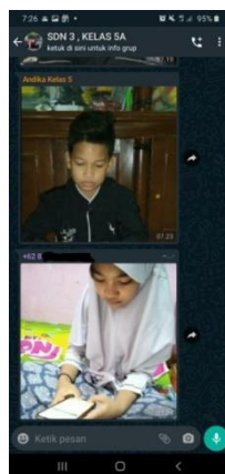
Gambar 3. Pakaian seragam sekolah di Whatsapp Group

Dengan media ini Guru dapat memberikan pembelajaran melalui sebuah group atau suatu tempat khusus dimana semua siswa dan guru berada dalam satu forum tersebut. Media tersebut tidak terlalu memakan banyak kouta internet dan mendapat pemberitahuan secara langsung kepada siswa tentang pelajaran yang akan di pelajari hari itu serta tugas yang harus di laksanakan oleh para siswa. Serta siswa dalam mengirimkannya kemabali untuk di berikan penilaian oleh Guru.