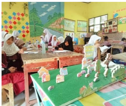
Gambar 3. Tahap pelatihan

Setelah penyampaian gambaran perbandingan jarak dan penskalan, guru menciptakan situasi belajar yang dapat membantu siswa untuk lebih memahami materi belajar yang baru dengan cara melibatkan siswa untuk bersama sama menjawab beberapa contoh soal yang berkaitan dengan perbandingan dan penskalan. Salah satu siswa di minta untuk menjawab soal yang ditulis guru di papan bor yang dimana satu siswa menjawab dan dibantu dengan teman lainnya untk menjawab dan menuntaskan soal yang diberikan, tujuan kegiatan ini selain untuk mengetahui kemampuan pemahaman konsep matematis siswa, yaitu untuk menciptakan suasana belajar lebih hidup, berinteraksi dan berperan secara aktif serta menciptakan kekompakan dan tanggungjawab terhadap beban tugas yang diberikan. Setelah kegiatan tadi, saat anak menjawab saol kedepan tetapi apa yang anak tulis di papan boar belum tepat dengan jawabannya, guru sedikit menjelaskan dan memperbaiki jawaban yang masih belum tepat, dan anak yang maju kedepan diminta untuk ketempat bangkunya dan guru meminta semua siswa untuk mengapresiasi siswa yang berani maju dengan memberikan standing aplouse.