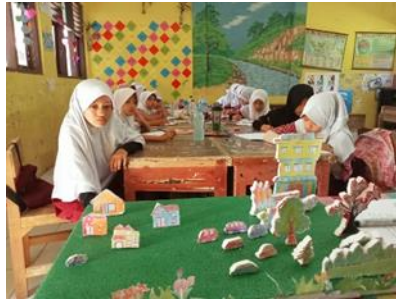
Gambar 2. Tahap penyampaian

Setelah penyampaian gambaran perbandingan jarak dan penskalan, guru menciptakan situasi belajar yang dapat membantu siswa untuk lebih memahami materi belajar yang baru dengan cara melibatkan siswa untuk bersama sama menjawab beberapa contoh soal yang berkaitan dengan perbandingan dan penskalan. Salah satu siswa di minta untuk menjawab soal yang ditulis guru di papan bor yang dimana satu siswa menjawab dan dibantu dengan teman lainnya untk menjawab dan menuntaskan soal yang diberikan, tujuan kegiatan ini selain untuk mengetahui kemampuan pemahaman konsep matematis siswa, yaitu untuk menciptakan suasana belajar lebih hidup, berinteraksi dan berperan secara aktif serta menciptakan kekompakan dan tanggungjawab terhadap beban tugas yang diberikan. Setelah kegiatan tadi, saat anak menjawab saol kedepan tetapi apa yang anak tulis di papan boar belum tepat dengan jawabannya, guru sedikit menjelaskan dan memperbaiki jawaban yang masih belum tepat, dan anak yang maju kedepan diminta untuk ketempat bangkunya dan guru meminta semua siswa untuk mengapresiasi siswa yang berani maju dengan memberikan standing aplouse.