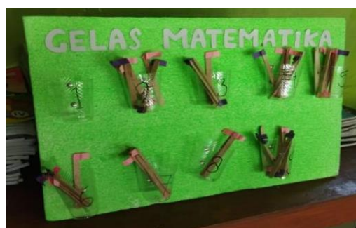
Gambar 3. Media Pembelajaran Gelas Matematika

Keberhasilan ini tidak lepas dari model pembelajaran RME (Realistic Mathematics Education) yang peneliti terapkan dalam pembelajaran. Dari hasil ide peneliti pada pembelajaran siklus II, peneliti membuat media alat peraga sebagai tambahan untuk pembelajaran dengan harapan agar peserta didik dengan mudah memahami konsep operasi hitung campuran.