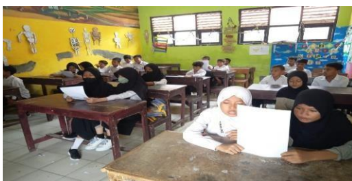
Pembiasaan membaca asmaul husna