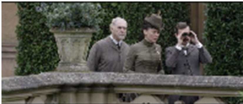
Gambar 1.12. Scene Dr Reid, Lady Churchill, Ponsonby memata-matai apa yang dilakukan Ratu Victoria dengan Abdul di taman.

Inferiority complex yang dialami Mohammed terhadap kerajaan Inggris dan Ratu Victoria terlihat jelas dari keinginannya untuk segera kembali ke India dan dia menunjukkan ketakutan akan mati jika masih berada di istana. Perasaan diri lebih rendah dan tidak memiliki kekuasaan apa-apa dari kaum terjajah di hadapan Kaum penjajah merupakan salah satu representasi dari inferiority complex . Keberadaan dan kedekatan Abdul dengan Ratu Victoria dianggap sebagai ancaman bagi orang-orang kulit putih dan anggota keluarga kerajaan. Hal tersebut tergambar dari beberapa scene dan percakapan berikut: