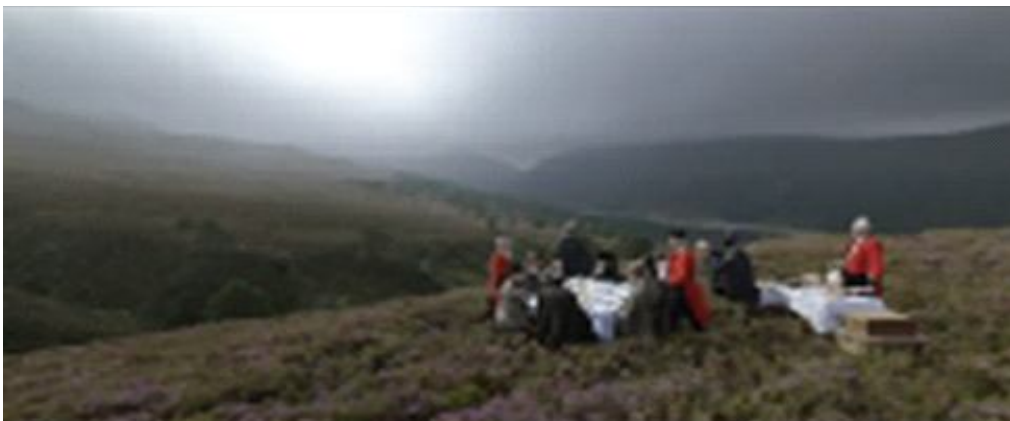
Gambar 1.7. Scene anggota keluarga kerajaan harus menemani Ratu Victoria minum teh diatas bukit

SCENE at top of the moor. scotland. day: Queen Victoria is sitting at her 'tea' table, formally set up and replete with every unnecessary accoutrement. It overlooks spectacular scenery, but Queen Victoria behaves as if she was in her back garden. Abdul and Mohammed stand to attention in the background. Mohammed sneezes. Butlers and maids serve the tea. Queen Victoria is very well wrapped up. She gorges herself on a sponge cake. Everyone else is cold and miserable.