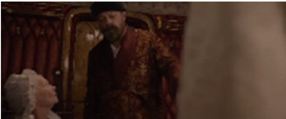
Gambar 1.13. Scene Bartie berbicara kepada Ratu Victoria mengeluhkan karena dirinya harus berbagi kamar mandi dengan Ibunya (Ratu Victoria)

Secene dan percakapan diatas menggambarkan adanya rasa kesal dan marah dari beberapa anggota kerajaan terhadap kedekatan Abdul dengan Ratu Victoria serta perbuatan mereka yang memata-matai apa yang dilakukan Ratu dengan Abdul merupakan cerminan sikap pengecut yang merupakan salah satu ciri inferiority complex yaitu cowardly. Ciri inferiority complex yang lain yaitu insecure yaitu mereka merasa tidak aman dengan keberadaan Abdul, mereka ketakutan dengan kedekatan Abdul dapat menggeser posisi mereka serta mengalihkan perhatian Sang Ratu dari mereka apalagi Abdul hanya seorang pelayan berkulit gelap dari India yang dipandang kedudukannya lebih rendah dari mereka. Bahkan perasaan insecure terhadap Abdul juga dirasakan oleh Bartie putra Ratu Victoria. Hal tersebut tergambar pada percakapan di bawah ini: