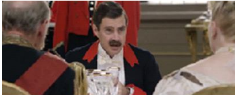
Gambar 1.6. Scene Dr Reid memberitahukan bahwa pelayan segera mengangkat mangkuknya setelah Ratu Victoria selesai makan

Dari perkataan Dr Reid diatas menunjukkan bahwa dalam ruangan tersebut keluarga kerajaan tidak dapat berbuat apa-apa selain mengikuti aturan dan mengikuti Ratu Victoria pada saat jamuan makan, dalam hal kecepatan menyantap makanan mereka tidak memiliki wewenang untuk menyantap makanan mereka sampai habis jika Ratu Victoria telah selesai menyantap makanannya walaupun mereka bahkan belum mencicipi makanan tersebut para pelayan akan segera mengangkat piring dan mangkuk di atas meja makan segera setelah Sang Ratu menghabiskan makanannya. Disini terlihat adanya inferiority complex dari anggota dan pejabat kerajaan dimana mereka merasa lebih rendah yang tidak memiliki kekuasaan lebih dibandingkan dengan Ratu Victoria sehingga mereka harus tunduk terhadap sang Ratu.