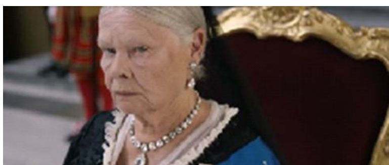
Gambar 1.3. Scene Ratu Victoria membalas tatapan dan senyuman Abdul