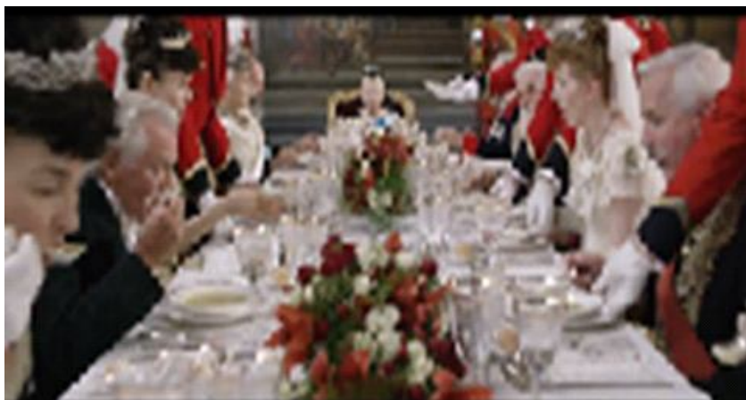
Gambar 1.5. Scene Scene Pelayan Kerajaan mengambil Mangkuk sup para tamu kerajaan walaupun mereka belum menghabiskannya