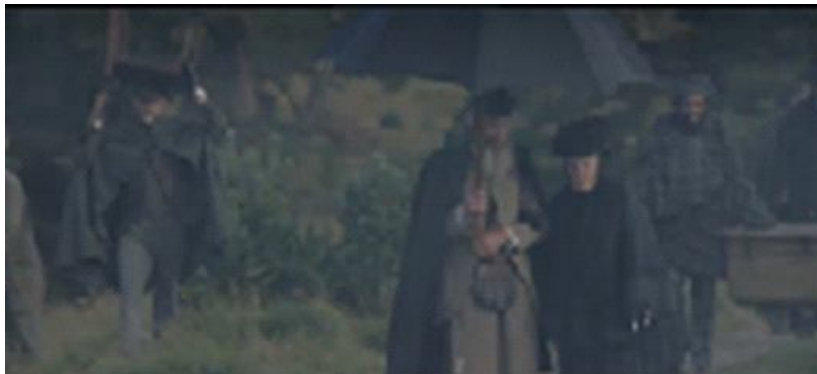
Gambar 1.8. Scene anggot keluarga kerajaan dan Ratu Victoria di tengah hujan setelah minum teh diatas bukit

Scene di atas menggambarkan sikap tunduk anggota keluarga kerajaan walaupun mereka tidak menyukai keadaan tersebut di mana mereka kedinginan dan menyedihkan menghadapi situasi di mana mereka harus jauh-jauh berjalan keatas bukit, dalam cuaca yang dingin dengan angin yang sangat kencang serta tiba-tiba di guyur hujan hanya untuk menemani Ratu Victoria minum teh, sementara Sang Ratu dengan sangat tenangnya meminum teh dengan badan yang sudah berbalut baju yang sangat hangat seolah-olah dia berada di taman belakang istana.