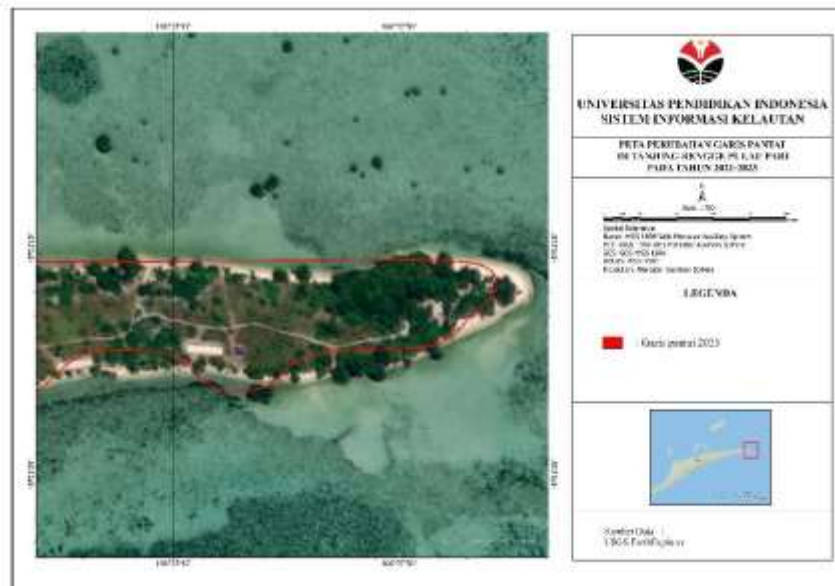
Gambar 4. Vektor garis pantai 2023 (Diolah peneliti tahun 2023)

Dari hasil gambar-gambar diatas berikut penggabungan vector garis pantai dari masing-masing tahun atau dari tahun 2021-2022-2023 bisa dilihat pada gambar 5.