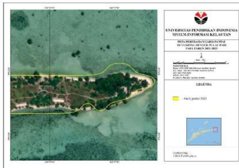
Gambar 3. Vektor garis pantai 2022 (Diolah peneliti tahun 2023)