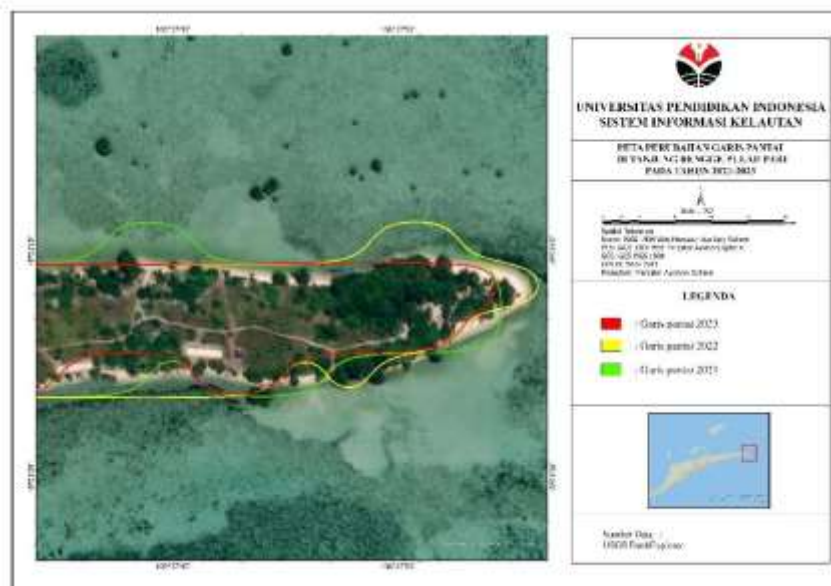
Gambar 5. Vektor garis pantai 2021-2023 (Diolah peneliti tahun 2023)

Dari hasil gambar-gambar diatas berikut penggabungan vector garis pantai dari masing-masing tahun atau dari tahun 2021-2022-2023 bisa dilihat pada gambar 5.