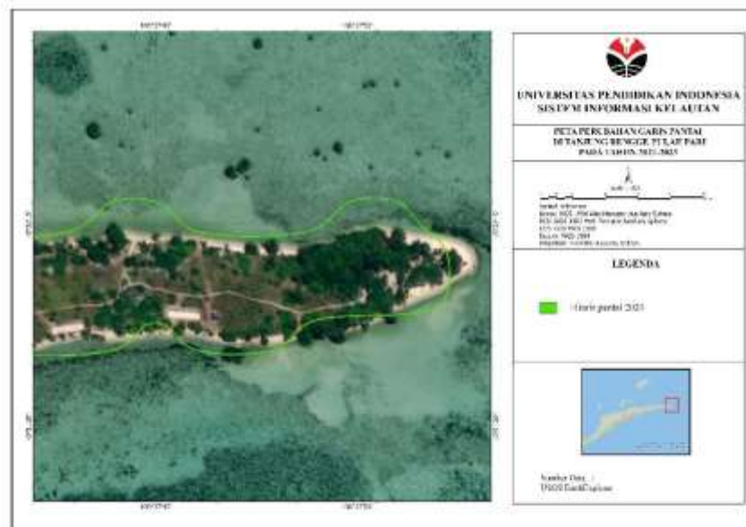
Gambar 2. Vektor garis pantai 2021 (Diolah peneliti tahun 2023)